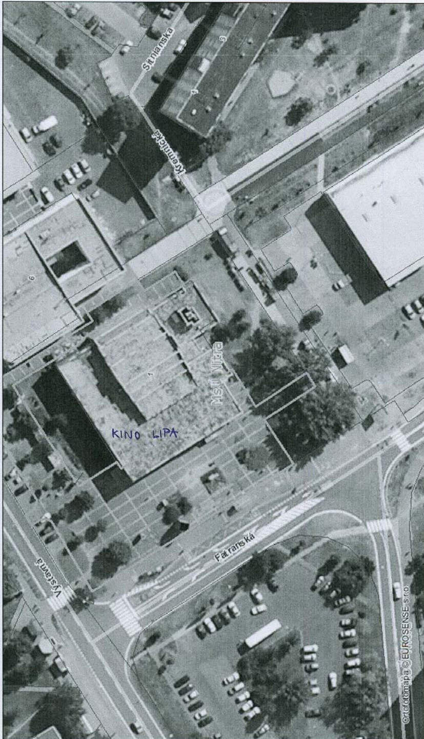
X UMIESTNENIE STÁNKU